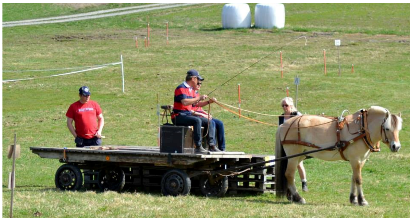
Team Muskot vid lastbryggan i Örebro.