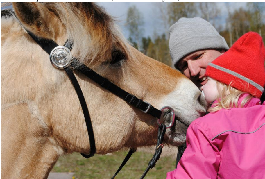
Team Jum-Jum myser efter den lyckade ritten i Dalarna.